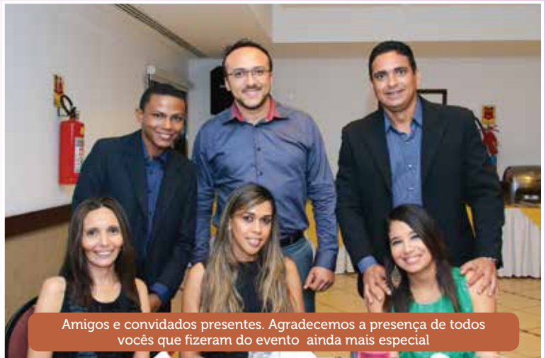
Amigos e convidados presentes. Agradecemos a presença de todos vocês que fizeram do evento ainda mais especial