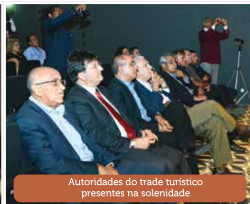
Autoridades do trade turístico presentes na solenidade