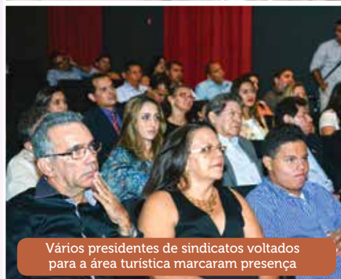
Vários presidentes de sindicatos voltados para a área turística marcaram presença