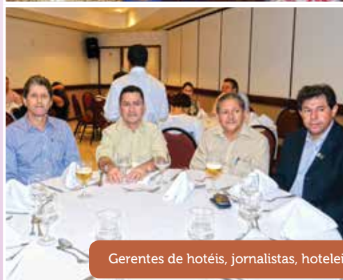
Gerentes de hotéis, jornalistas, hoteleiros fizeram parte da magia do Prêmio