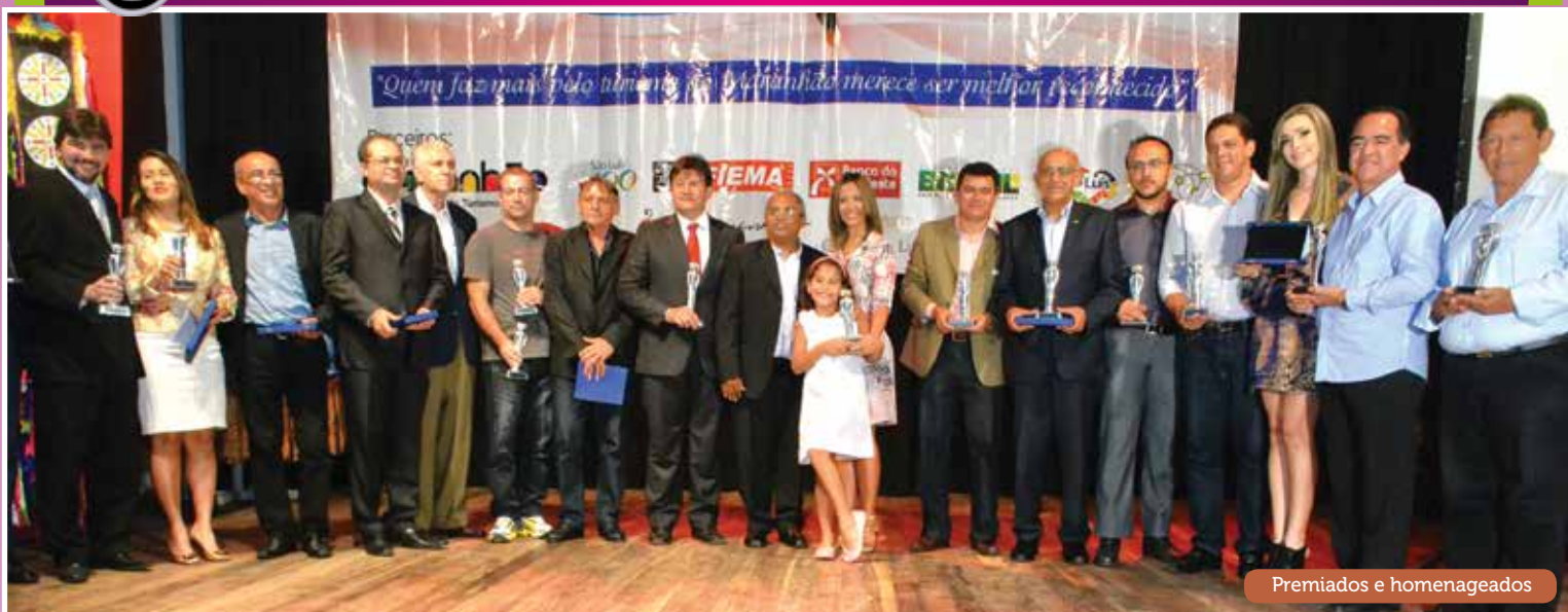
Premiados e homenageados

Celebração e glamour na primeira edição do evento que promete virar marco no calendário maranhense